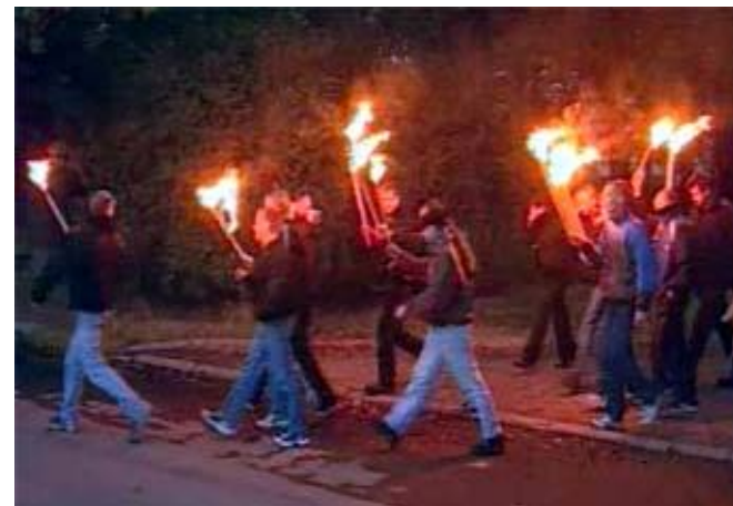
Скинхеды. Факельное шествие в Петербурге.