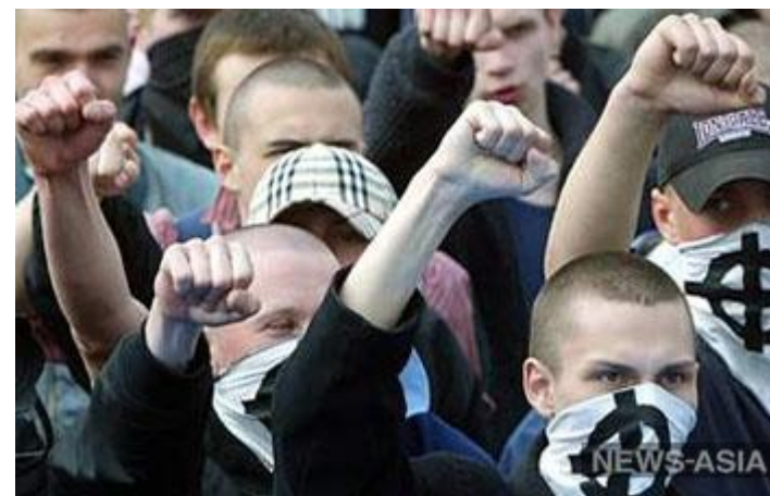
В Костроме скинхеды напали на неформалов